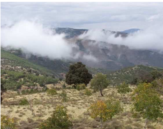
Camino de los Sapos