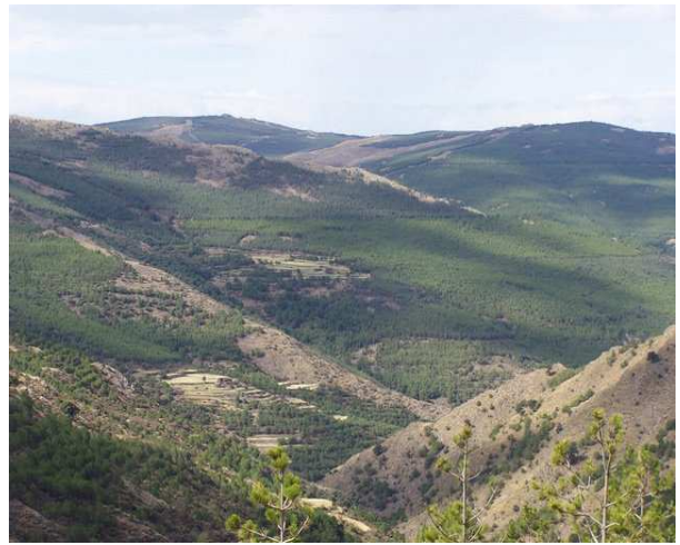
Antiguo poblado minero de las Menas - Pinares de la Sierra desde las Menas