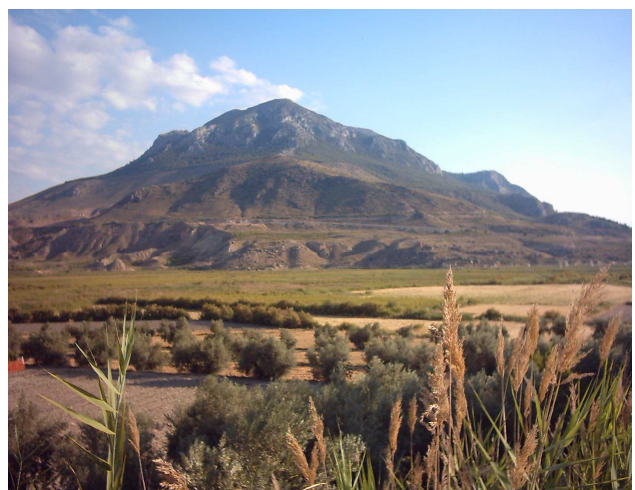
- Vista panorámica del Cerro Jabalón