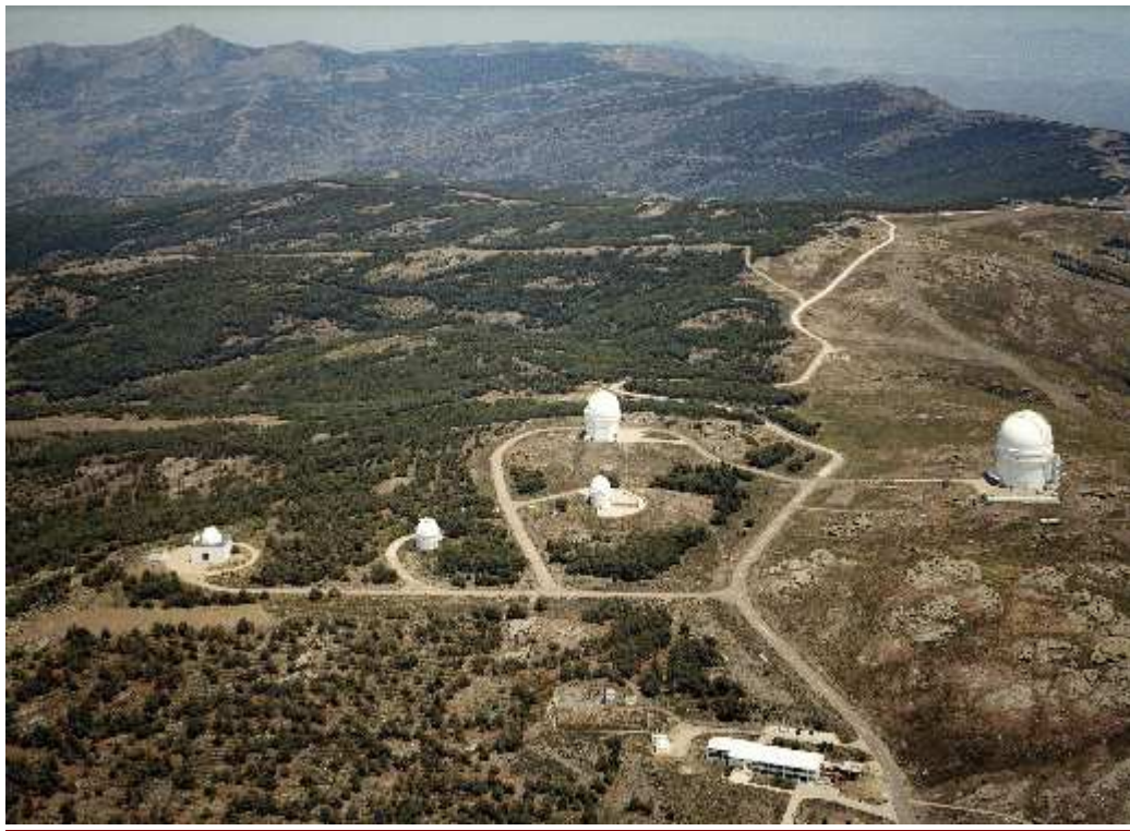
Vista del Observatorio Hispano – Alemán de Calar Alto