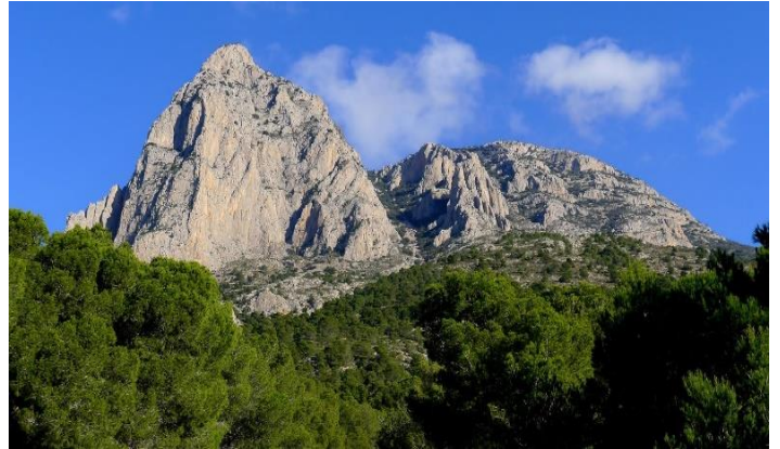
Paisaje Protegido Puig Campana y el Ponots