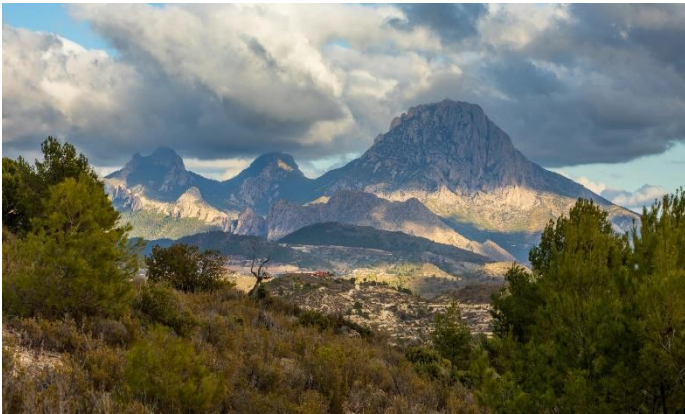
Sierra de Aitana